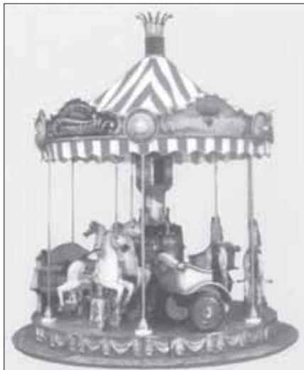
zum Schützenfest Anfang August Kostenlos für unsere kleinen Gäste