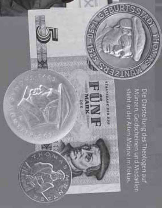
Die Darstellung des Theologen auf Münzen, Geldscheinen und Medaillen steht in der Alten Münze im Fokus.