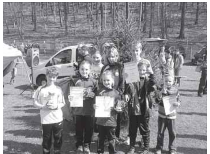
Die erfolgreichen Starter aus Grillenberg