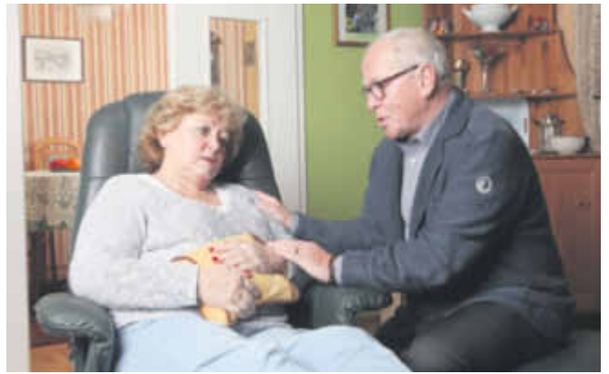
Kennen Sie das – diese Bauch- und Magenbeschwerden, Blähungen, leichte Übelkeit und das unangenehme Völlegefühl nach dem Essen. Ernährungs-Experten vermuten, dass der deutliche Anstieg von Verdauungs-Beschwerden mit unserer fast bitterstoffreichen Ernährung zusammenhängt