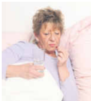
Schlafstörungen sind die Geißel unserer Zeit. Betroffene greifen in ihrer Not oft zum starken Schlafmittel, dessen Einnahme abhängig machen kann. Schlafforscher empfehlen dagegen, die Ursache der Schlafstörungen auszuschalten

Für den Akutfall oder häufig wiederkehrende Beschwerden gehört Gasteo® (UVP: 20ml 7,85 Euro, PZN 1073 8439) in jede Haus-Apotheke.