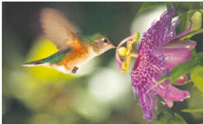
Schon die Indianer kannten die nervenberuhigenden, stärkenden und entspannenden Eigenschaften der Passionsblume. Sie glaubten auch, dass ihre Wirkung dem Menschen schöne Träume schenkt

Die grüne Kapsel von Lioran® gibt ihren besonderen Passionsblumenkraut-Extrakt bereits innerhalb von 30 Minuten frei. Dann beginnt Lioran®, seine entspannende, ausgleichende und angstlösende Wirkung zu entfalten. 2 Kapseln am Abend schenken den gesunden Schlaf, am Tag wird Lioran® mit 1 bis 3 Kapseln je nach Stressempfinden dosiert. Das Natur-Medikament ist zucker- und glutenfrei und macht weder tagsmüde noch abhängig. Wechselwirkungen mit anderen Arzneimitteln sind nicht bekannt, die Einnahme ist zeitlich nicht begrenzt. Der Bundesverband Deutscher Apotheker hat Lioran® die Passionsblume nicht umsonst als Medikament des Jahres 2014 ausgezeichnet.