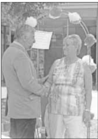
Beglückwünschung des Bürgermeisters zum wohlverdienten Ruhestand