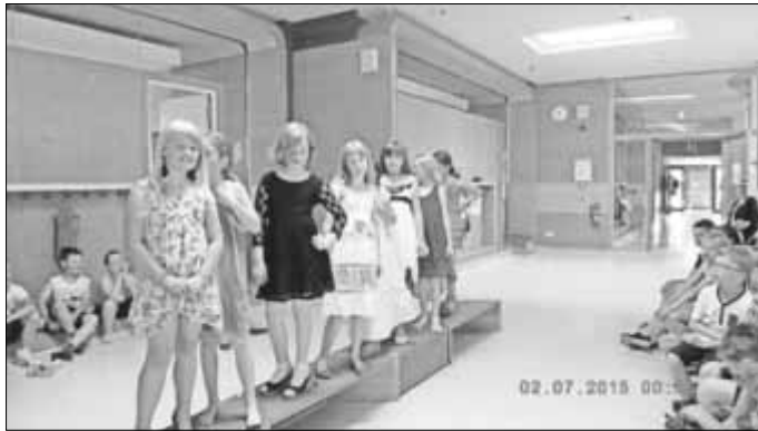
Modenschau der Mädchen - die Jungs waren die Jury.