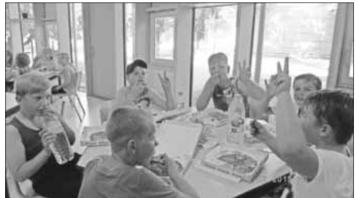
Zum Abendbrot ...