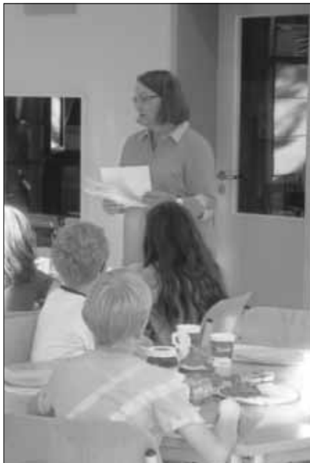
Urkundenübergabe durch Frau Bauersfeld