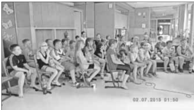
Fernsehieber mit „Emil und die Detektive“