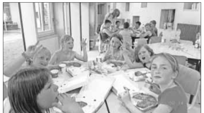
... gab es Pizza