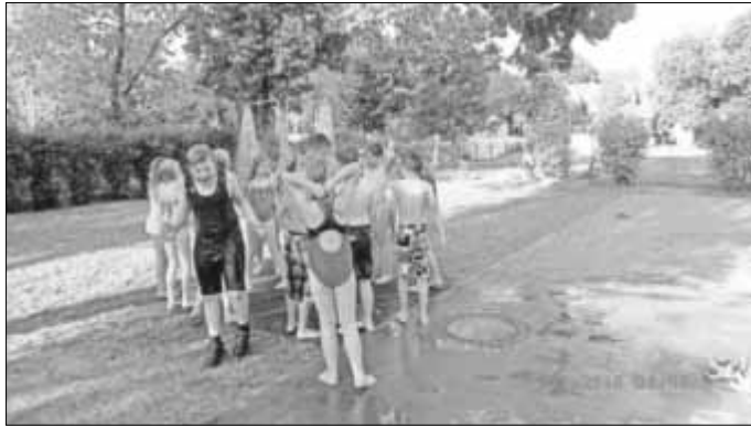
Abkühlung auf dem Schulhof