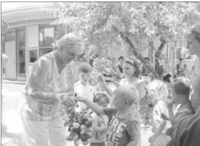
Die Kinder überreichten Rosen - Symbolisch stand eine Rose für ein Arbeitsjahr

Das Lied der Schützlinge „Eigentlich brauche ich zum Glücklich sein nicht viel“ stimmte alle Anwesenden froh und heiter.