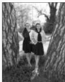
Roßla, im Mai 2016