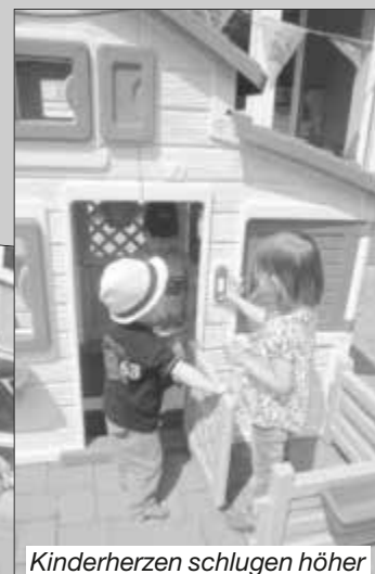
Kinderherzen schlugen höher