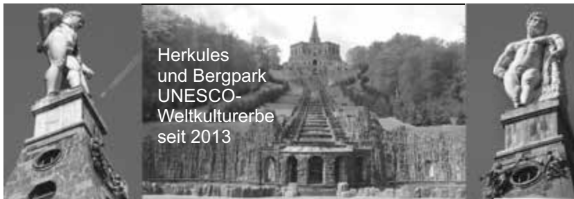
Herkules und Bergpark UNESCO- Weltkulturerbe seit 2013