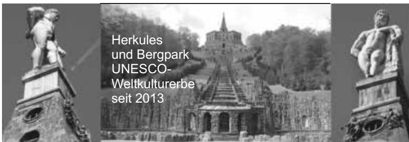
Herkules und Bergpark UNESCO-Weltkulturerbe seit 2013