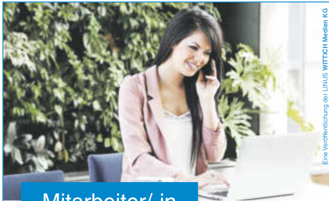
Eine Veröffentlichung der LINUS WITTICH Medien KG

Lokal informiert. Druck. Internet. Mobil.