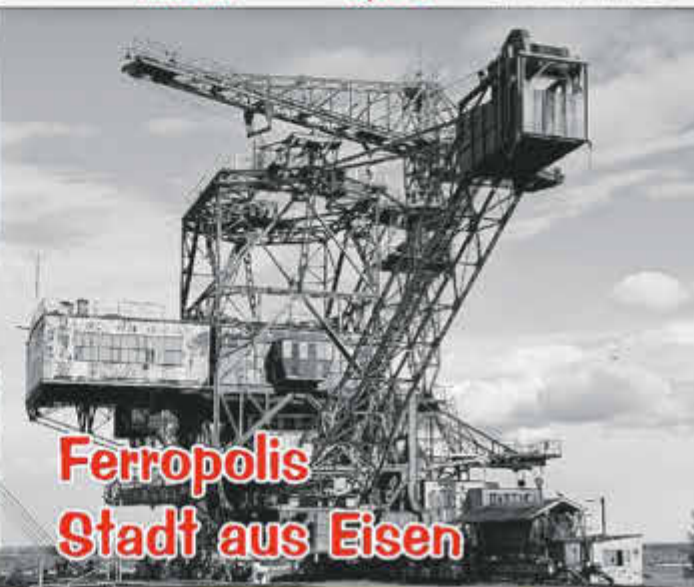
Ferropolis Stadt aus Eisen

*Ein Produkt der Mansfelder Bergwerksbahn e. V.