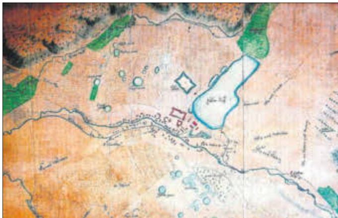
Überarbeiteter Auszug der Penther-Karte von 1722