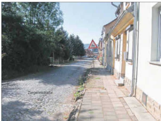
Ziegeleistraße vor der Sanierung

Der Anfangswert -A- ist der Bodenwert, der sich ergeben würde, wenn keinerlei Sanierungsmaßnahmen stattgefunden oder beabsichtigt wären. Es ist der maßgebliche Zustand, wie er ohne Aussicht auf Sanierung, deren Vorbereitung und Durchführung besteht. Er stellt den Wert dar, welcher z. B. den Zustand der Straße vor dem grundhaften Ausbau widerspiegelt (z. B. Wilhelmstraße, Helmestraße, Karlstraße, Entenplatz, Ziegeleistraße)