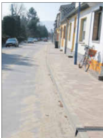
Ziegeleistraße nach dem grundhaften Ausbau

Er bringt die Verbesserung durch z. B. den grundhaften Ausbau der Straßen mit Verbesserung der Parksituation und Zufahrten zum Ausdruck. Die Differenz aus Anfangs- und Endwert ergibt die Bodenwerterhöhung.