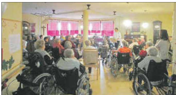
Betreuungsteam „Marienstift“ Roßla