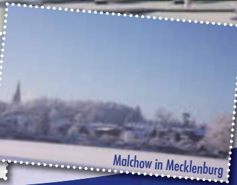
Malchow in Mecklenburg

Tel: 039932-825201 · info@ferienkontor-mv.de stadthafen-malchow.com