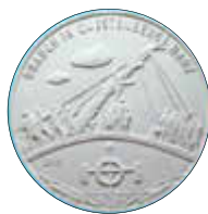
Abbildung des Gipsmodells der Jahresmedaille 2019, nach der der Prägestempel gefertigt wurde. Die neue Jahresmedaille wird in Feinsilber, 999er Ag, 20 Gramm, Durchmesser 35 mm, am großen Balancier im Museum ALTE MÜNZE, seit dem 01.01.2019 geprägt.

Seit dem 01.01.2019 PRÄGEN wir die JAHRESMEDAILLE 2019 in der historischen Münzwerkstatt im Museum ALTE MÜNZE in der Niedergasse 17 in Stolberg. Die JAHRESMEDAILLE 2019 ist dem QUESTENFEST und der QUESTE – einem uralten, besonderen Brauch in Questenberg, im Südharz – gewidmet.