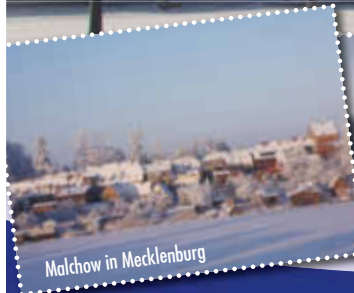
Malchow in Mecklenburg