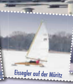
Eissegler auf der Müritz