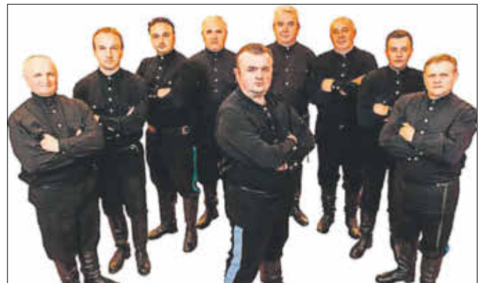
Ural Kosaken Chor