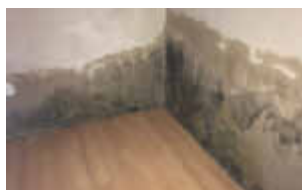
Beispielhafte defekte Horizontalsperre

Auf unseren typischen Schadensbildern werden die Folgen einer defekten Horizontalsperre bzw. einer Querdurchfeuchtung sichtbar. Wenn diese Schäden lange unbehandelt bleiben, durchdringen bauwerksschädliche Salze das Mauerwerk, es kann sich Schimmel bilden und Ausblühungen und Salpeter werden überall sichtbar.