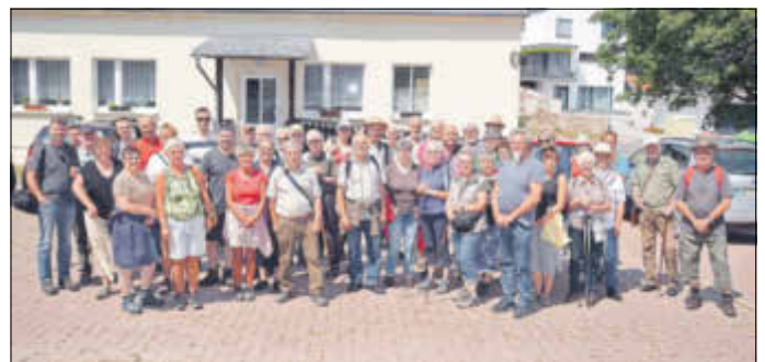
48 Personen nahmen an der „Sommertour“ in Rotha teil. Organisiert wurde die Veranstaltung vom Heimatverein Rotha, dem Biosphärenreservat und dem Geschichtsverein „Goldene Aue“.