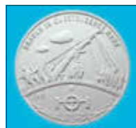
Abbildung des Gipsmodells der Jahresmedaille 2019, nach der der Prägestempel gefertigt wurde. Die neue Jahresmedaille wird in Feinsilber, 999er Ag,

Die JAHRESMEDAILLE 2019 ist dem QUESTENFEST und der QUESTE - einem uralten, besonderen Brauch in Questenberg, im Südharz - gewidmet.