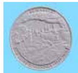
Abbildung des Gipsmodells der Jahresmedaille 2020, nach der der Prägestempel gefertigt wurde. Die neue Jahresmedaille wird in Feinsilber,

Die JAHRESMEDAILLE 2020 ist der Höhle „Heimkehle“ und der touristischen Ersterschließung vor 100 Jahren gewidmet.