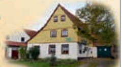
Dorf- und Wandercafe ab Mitte Mai jeden Sonntag von 14 Uhr - 18 Uhr geöffnet