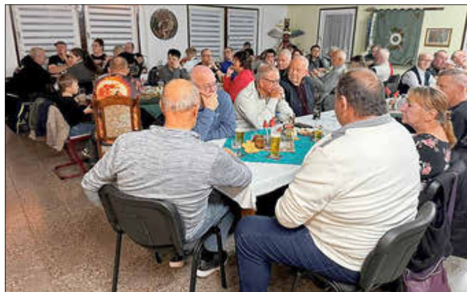
Zahlreiche Gäste waren erschienen zur Dankeschön Feier

Wir die Schützenkompanie 1848 „Goldene Aue“ Roßla feierten am 15.11.2025 unser Dankeschön Feier zu unseren diesjähriges Schützenfest. Hiermit möchten wir wieder Danke sagen an all denen die uns immer wieder helfen und unterstützen, den Vereinen und Sponsoren. Ohne diesen Zusammenhalt würde so manches nicht gelingen. Mittlerweile feiern wir das größte Schützenfest im Kreis.