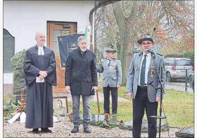
Der Ortsbürgermeister Uftrungen

Erstmals wurde in einer Schweigeminute durch alle Anwesenden den im Jahr 2025 verstorbenen Einwohnerinnen und Einwohnern aus unserem Ort gedacht.