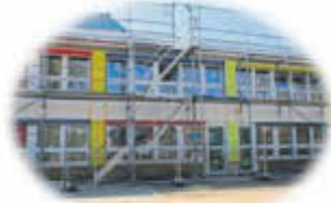
Kinderschulbusse @ Güter-Tattoo