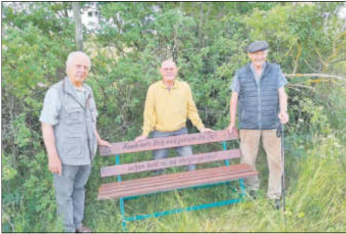
16.04.2023: Bank am Wiesenweg zum kleinen Brocken