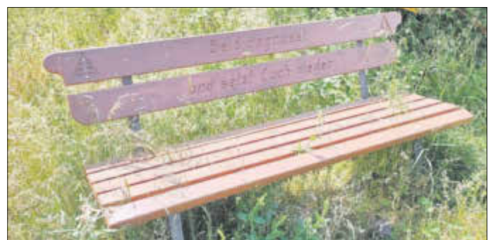
20.05.2021: Bank am Weg zur Eisengrube