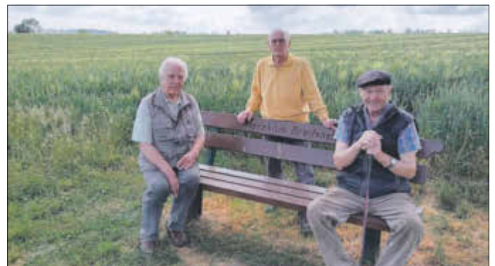
05.04.2019: Bank am Trimmdich-Pfad