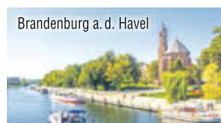
Brandenburg a. d. Havel

Ihr Hotel empfängt Sie in Brandenburg an der Havel mit Restaurant, Frühstücksraum, einer Bar, Terrasse, Abstellmöglichkeiten für Fahrräder, Fernsehhecke und einem Aufzug.