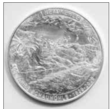
Jahresmedaille 2020 in Feinsilber „100 Jahre HEIMKEHLE“

In der historischen Münzwerkstatt der ALTEN MÜNZE in Stolberg werden an beiden Tagen, von 11:00 – 16:00 Uhr, die Feinsilber-Jahresmedaillen 2020 am großen Balancier geprägt, die dem 100-jährigen Jubiläum der HEIMKEHLE gewidmet sind. Die Medaillen werden an dem Fest-Wochenende auch an der HEIMKEHLE erhältlich sein.