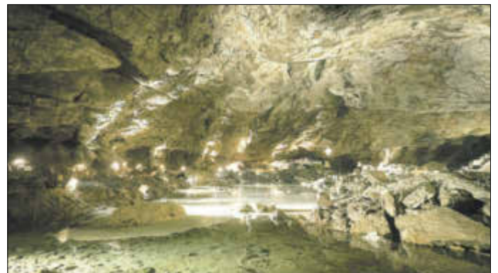
Großer Dom in der Heimkehle