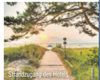
Strandzugang des Hotels